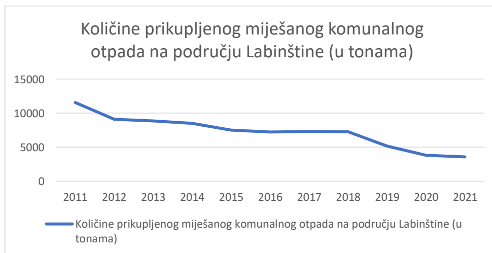
Grafikon 1.: Kretanje ukupne količine prikupljenog miješanog komunalnog otpada na području Labinštine u razdoblju 2012.-2021. godine (u tonama)

Grafički prikaz ukupnih količina prikupljenog miješanog komunalnog otpada za cijelu Labinštinu, a prema podacima iz tablice 9., prikazan je u grafikonu 1., te je iz njega vidljiva linija opadanja količina prikupljenog miješanog komunalnog otpada na Labinštini: